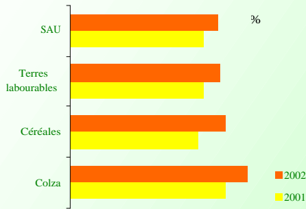
Lecture dernière période du titre A